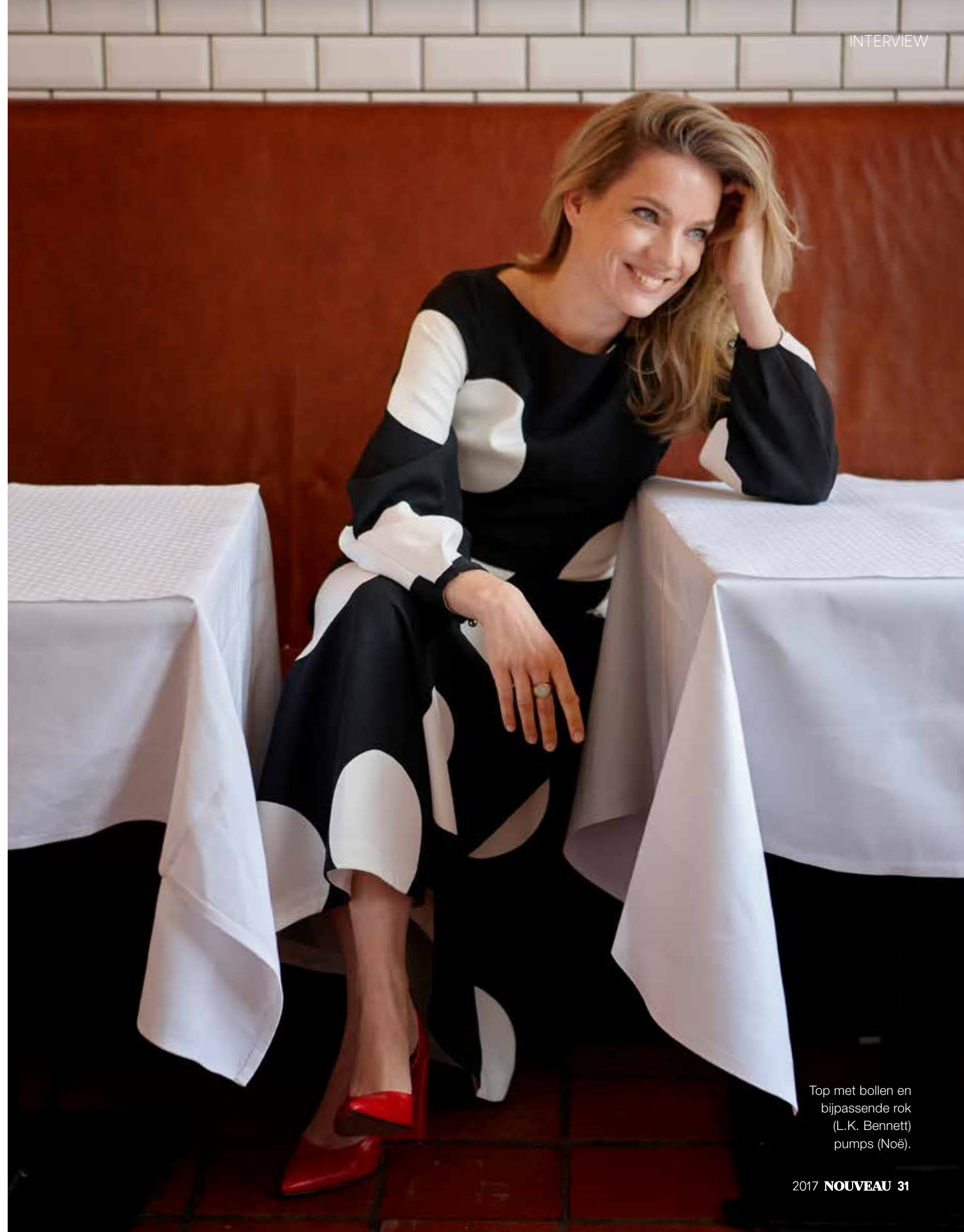
Top met bollen en bijpassende rok (L.K. Bennett) pumps (Noë).

STYLING: INGE HOLKENBORG / HAAR & MAKE-UP: ERIKA NUYTEN VIA ANGÉLIQUE HOORN / MET DANK AAN: CAFÉ COLETTE IN HAARLEM