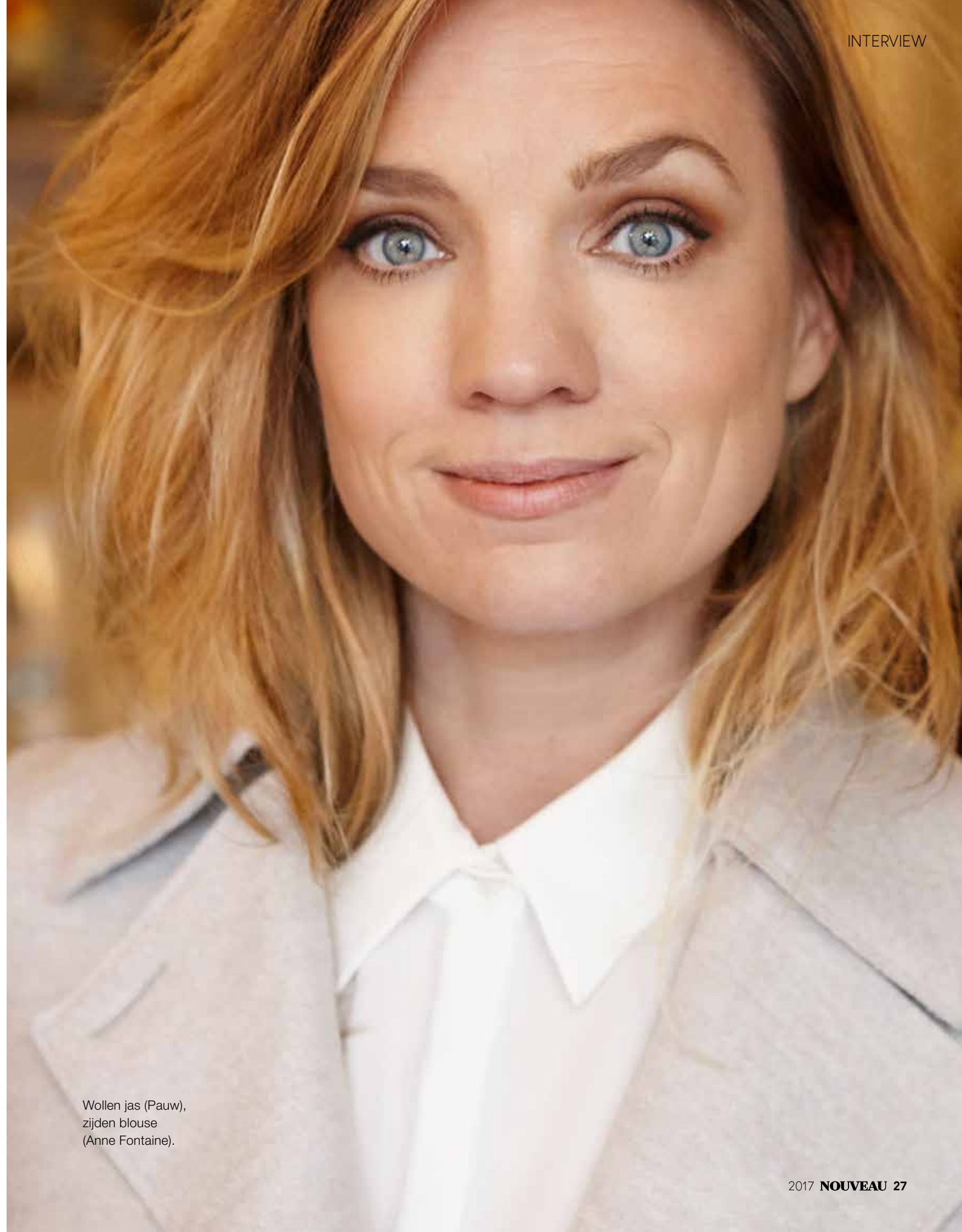
Wollen jas (Pauw), zijden blouse (Anne Fontaine).

Nou, de mensen met wie je werkt – dat is nogal intiem. Ze zijn geen familie, maar ze zijn wel heel vertrouwd. “Ja. Dat moet. Die vertrouwdheid moet er zijn. Anders werkt het niet. En we lachen heel veel. Je hebt je lievelingen, bij wie je graag zit tijdens de lunch. Bij mij zijn dat de jongens van de techniek. Daar ben ik dol op. Die ‘niet lullen maar poetsen’-mentaliteit. Gerrit bijvoorbeeld, die werkt al vanaf zijn zestiende bij het Nationale Toneel, die praat de hele dag door plat-Haags, kent iedereen. Daar hou ik heel erg van. En je hebt collega’s met wie je heel persoonlijk bent. Ja, in die zin is het wel familie. Je hoort van elkaars sores, je ziet elkaars blote kont, je ziet elkaar lelijk spelen en zoeken en knokken. In die zin is het een heel romantisch vak, ja. Het theater